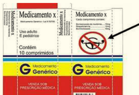
Figura 3 - Pictograma proposto peal ABRAMET previamente aprovado em audiência publica realizada pela Anvisa

Em 2009, a Associação Brasileira de Medicina de Tráfego (ABRAMET) enviou a Agência Nacional de Vigilância Sanitária (Anvisa) uma proposta, aprovada em audiência pública, de “símbolo de alerta” para as embalagens dos MPPCVA (abaixo).