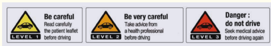
Figura 2 - Exemplo de pictograma